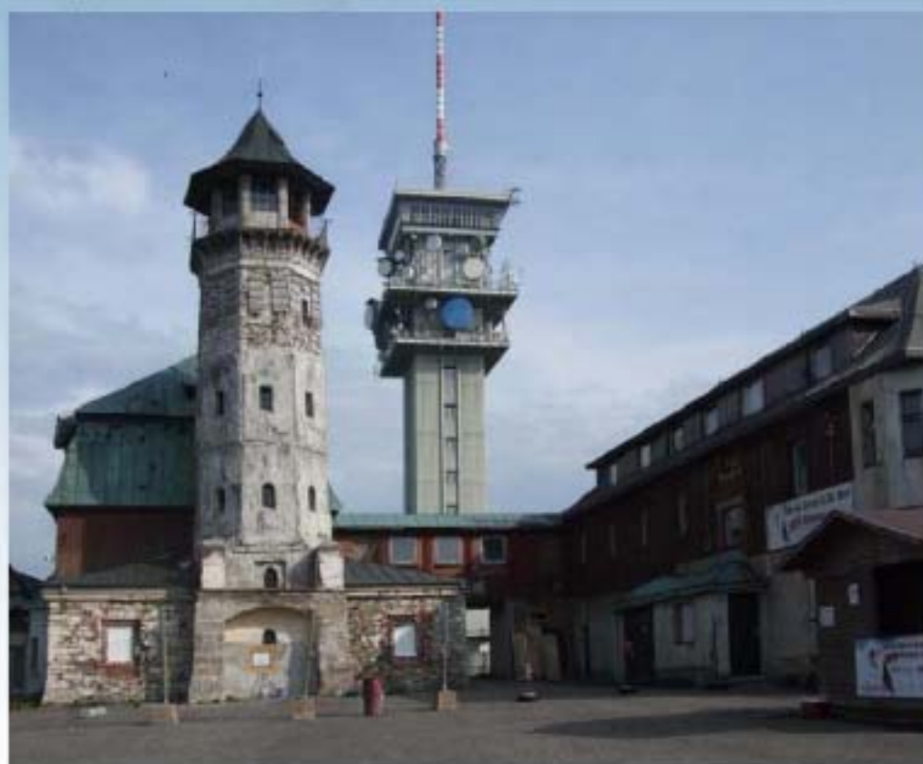
Sendeturm auf dem 1244 m hohen Klínovec/Keilberg, dem höchsten Berg im Erzgebirge, in der tschechischen Region Karlovarský kraj gelegen

herausgegeben vom UKW/TV-Arbeitskreis der AGDX e.V.